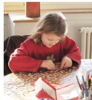
Poetische Sätze erfinden mit Lyrik- schnipseln