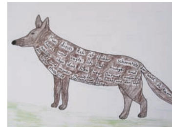
Seite aus einem Bilderbuchprojekt