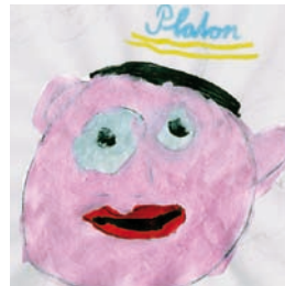
Der Philosoph Platon