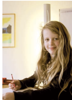
Impression aus dem Mentorat