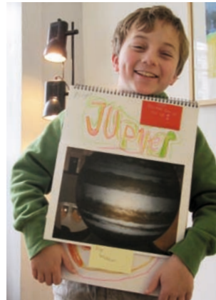
Plakat nach Exkursion zum Museum Focus Terra